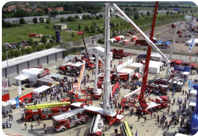
Hoch hinaus zur Interschutz 2010

Ständige Weiterbildung bleibt ein Muss, um auf dem Laufenden zu bleiben. Alle Mitarbeiter der Ingenieurbüro Schilling GmbH haben sich im Juni 2010 auf der Interschutz in Leipzig mit den aktuellen Entwicklungen auf dem Gebiet Brandschutz vertraut gemacht.